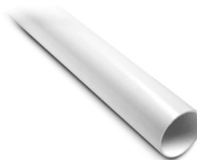
V131 Tuyau en PVC 2 po (51 mm) de diam. 10 pi (3,0 m) de long