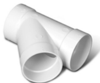
V123 Raccord en « Y » à 45° 2 po (51 mm) de diam.