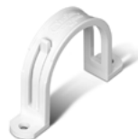
V140 Collet de tuyau 2 po (51 mm) de diam.