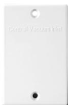
V138 Plaque de recouvrement avec vis