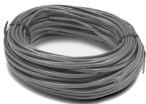
V133 Fil à basse tension 100 pi (30,5 m)