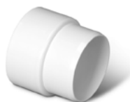
V139 Rallonge d'admission