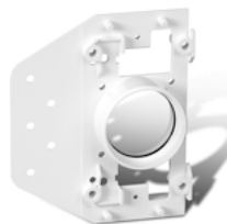
V144 Support de montage en plastique