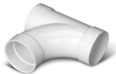
V124 Raccord en « T » à 90° 2 po (51 mm) de diam.