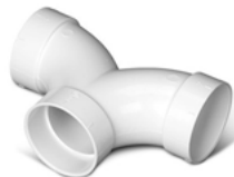
V125 Raccord en « Y » à 90° 2 po (51 mm) de diam.