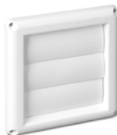
V142 Trappe extérieure